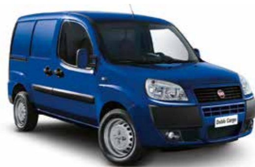
479 — Синий (BLU GIUDIZIOSO)