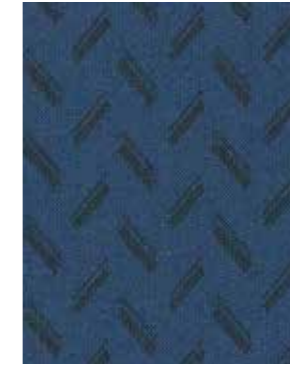
141 CALP BLUE (синяя ткань)