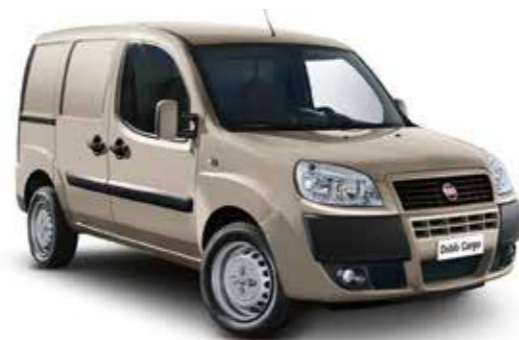
261 — Слоновая кость (AVORIO FAMILIARE)