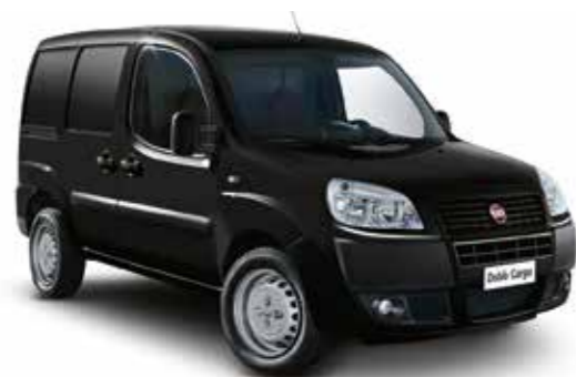
632 — Черный (NERO COSCIENZA SPORCA)

Цвета, показанные на данной странице, приведены для справки, поскольку цветная печать не может в полной мере воспроизвести истинные цвета окраски кузова.