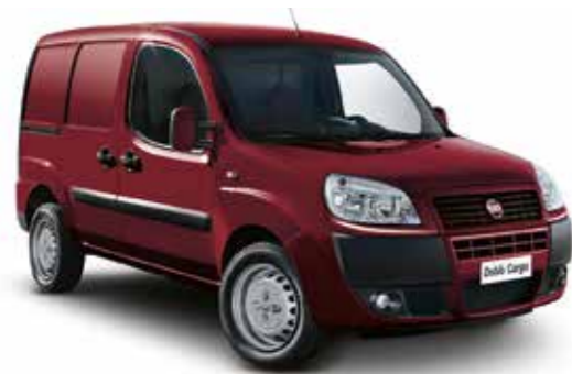
293 — Красный (ROSSO ESUBERANTE)