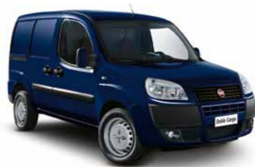
487 — Темно-синий (BLU NOTTURNO)