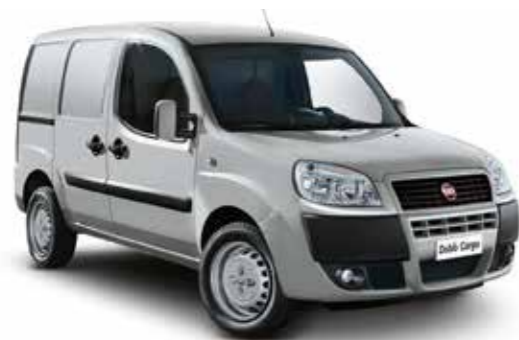
612 — Серый (GRIGIO GARBATO)