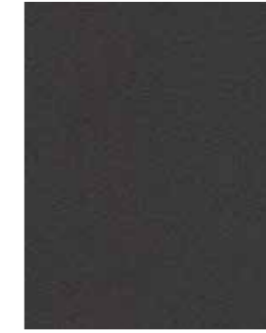
829 GREY (искусственная кожа)