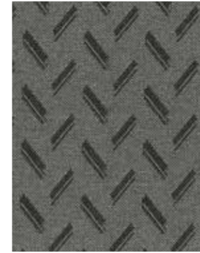
111 CALP GREY (серая ткань)